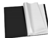
Un porte vue 60 pages