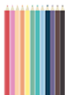
12 crayons de couleur (minimum)