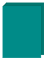
3 grands classeurs (dos 40mm) 4 anneaux (idéalement : bleu, rouge, vert)