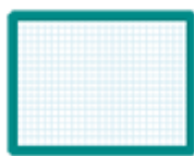
1 ardoise blanche