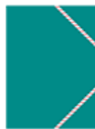
3 pochettes à rabats