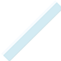
une règle 30cm en plastique dur